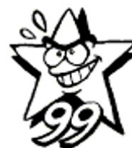
csOA Officina 99 www.officina99.org